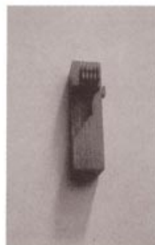
boven: Doorgang, beton, stuc, coating 1995 18 x 20 x 23 cm onder: Ingekeerd, aluminium-kunststof 1997 19,5 x 5,2 x 5,2 cm